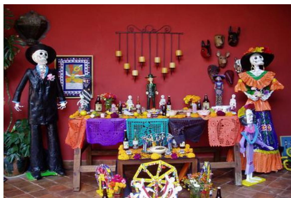
Boreta, Jocelyn. September 27, 2012. Retrieved from http://www.globalexchange.org/blog/fairtrade