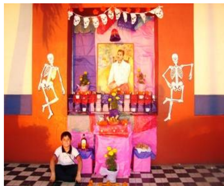
Altars de Muertos en Mazatlán.

In México, Day of the Dead is celebrated on November 1 and 2. November 1 is reserved for children and infants who have passed away. On November 2 adults are remembered. Day of the Dead has been a part of Mexican culture and history for centuries. In fact, components of the celebration can be traced back to a well known Aztec festival. These days are truly celebrations in México and even parts of the United States.